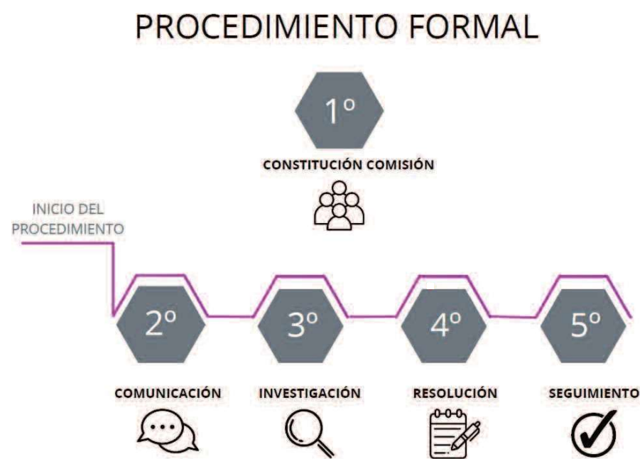
Infografía 3. Procedimiento formal

En todo caso, al objeto de garantizar la confidencialidad, no se darán datos personales y se utilizarán los códigos numéricos asignados a cada una de las partes implicadas en el expediente.