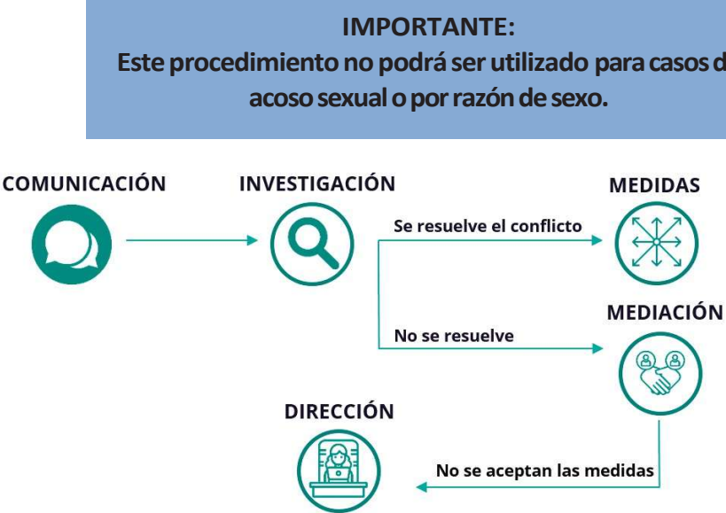
Infografía 1. Procedimiento de resolución de conflictos

En el caso de que dos o más personas se hallen en conflicto, o que este sea detectado por una persona externa, se podrá utilizar el sistema de resolución de conflictos que propone la organización si, de manera voluntaria , las partes están de acuerdo.