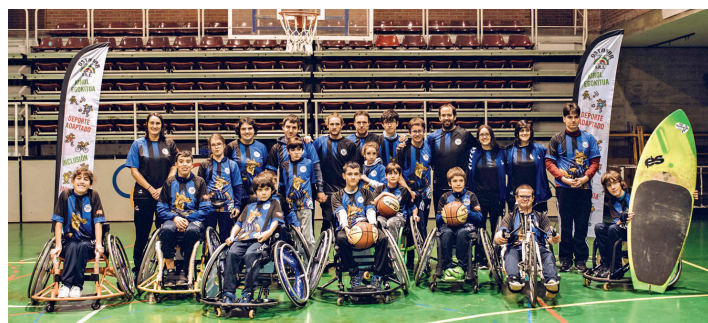
Ostadar Saiarre K.T.

Es decir, las federaciones nacionales e internacionales de deportes como el ciclismo, el tenis de mesa, el triatlón o la vela son ya quienes en la actualidad organizan las competiciones federadas de sus respectivas modalidades para personas con discapacidad. Y este proceso ha derivado en la invención de nuevos nombres para denominar a esas secciones deportivas destinadas a las personas con discapacidad dentro de cada federación.