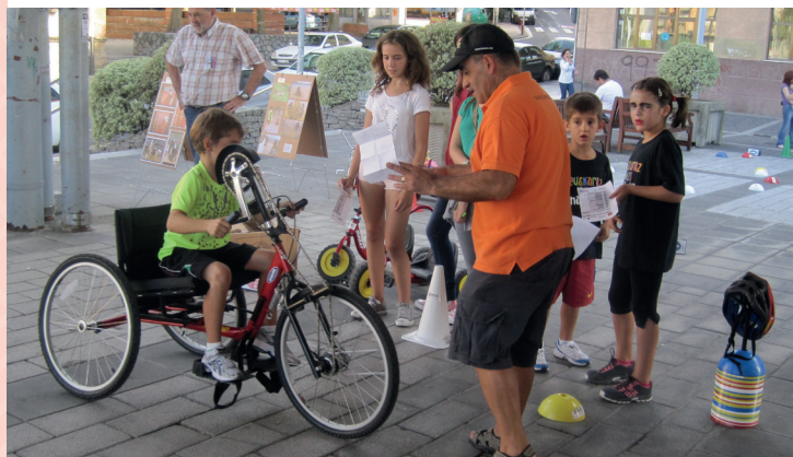
Jornada de sensibilización Kemen K.E.

Es importante analizar el marco legislativo sobre la Actividad Física y el Deporte Adaptado e Inclusivo , porque este nos va a permitir entender mejor el proceso y la evolución que ha tenido la legislación relacionada con las personas con disCAPACIDAD y la práctica físico-deportiva . A continuación citamos algunas de las leyes, decretos y disposiciones de referencia.